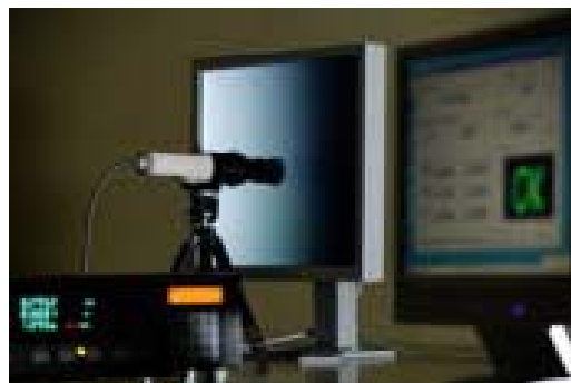
(每一台階調的測定與調整(如圖的畫面：實際為在暗室中進行))

另外在工廠出貨時，將每一台 Gamma 值測定・調整至正確的 Gamma 值：1.8。因為今後時 Gamma 值的變更或進行調整的是計算時調整的，所以工廠設定提供平滑的 Gamma 曲線維持正確的 Gamma 值。